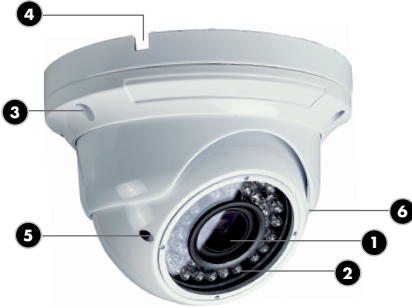
Abb. 1 / Diagram 1