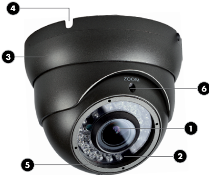
Abb. 2 / Diagram 2